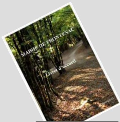
Le livret d'accueil