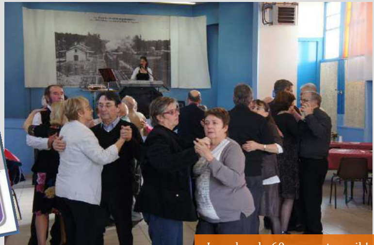
Les plus de 60 ans au travail !