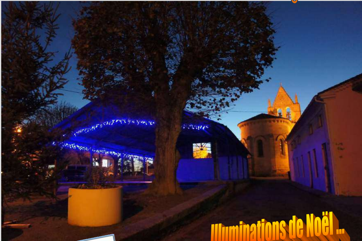
Illuminations de Noël ...